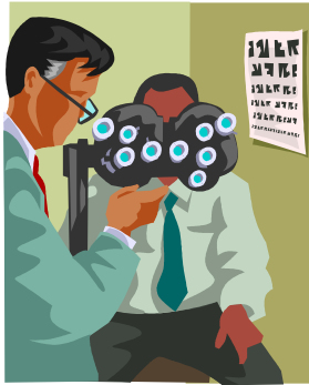
Gambar 2.3 Nama gambar